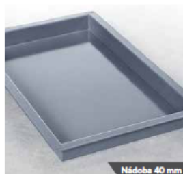
Nádoba 40 mm