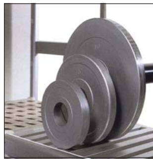
Špeciálne police na guľaté veci